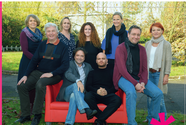
Das Beratungsteam der Ricarda-Huch-Schule

Wichtige Adressen und Seite 18 Beratungsstellen